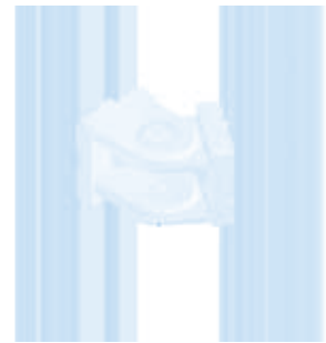
Gelenk 30 Pivot Joint 30