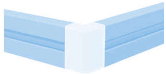
Rahmen-Eckverbinder 20 × 40 (Set) Frame Corner Connector 20 × 40 (Set)