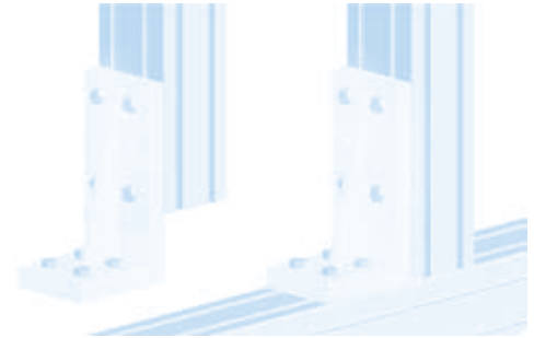
Verstiefungswinkel 80 × 180 Support bracket 80 × 180